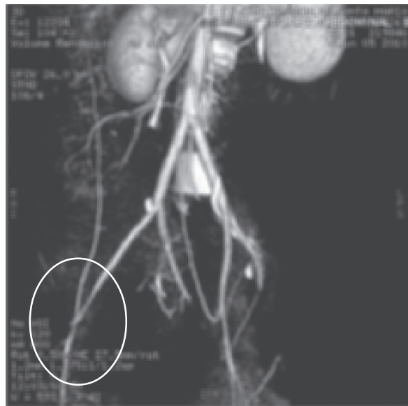
Figura 2. Se aprecia lesión severa en el tercio distal de la arteria ilíaca externa derecha con la unión de la femoral común.