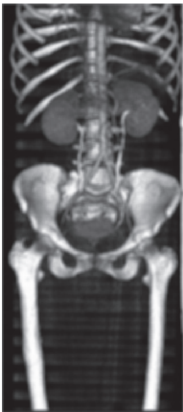
Figura 1. Aorta abdominal de calibre normal sin lesiones ateroscleróticas. Ambas arterias ilíacas comunes de calibre muy delgado (vasoespasmo). No se aprecia el lecho distal de ambas femorales comunes por la vasoconstricción.

Luego de 72 horas, el dolor había cedido y se dio de alta con profilaxis con nimodipino para el control de la migraña.