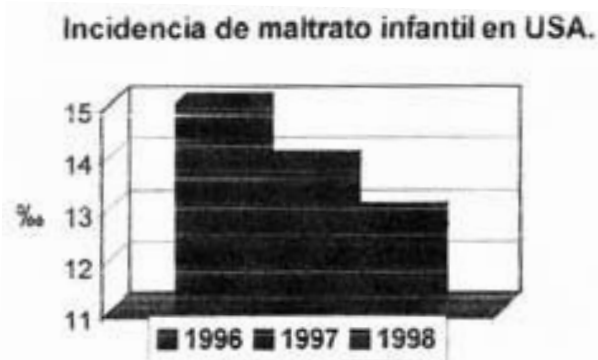
Figura 1. Incidencia de maltrato infantil en USA por cada 1000 niños 19 .

encubriéndose un maltrato físico. La mayoría de los abusos sexuales, negligencias y maltratos psicológicos nunca se denuncian. Los datos existentes no siempre se publican de forma reglada en todos los países y regiones, haciendo aun más difícil conocer con exactitud su magnitud. Aun así vamos a intentar obtener una idea lo más exacta posible de la dimensión del problema.