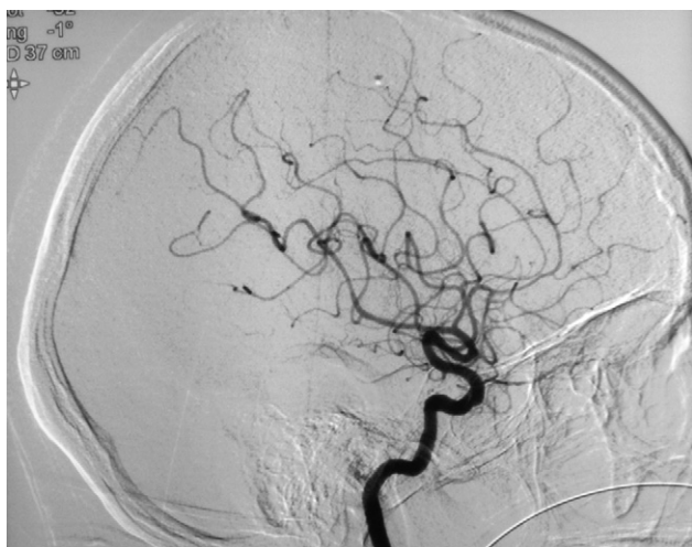
Figura 2 Arteriografía cerebral que muestra imágenes sugestivas de arteritis de pequeño vaso.

damentalmente en la sospecha clínica, la dosis administrada se individualizó a pulsos de 600 mg/m 2 cada 3 semanas.