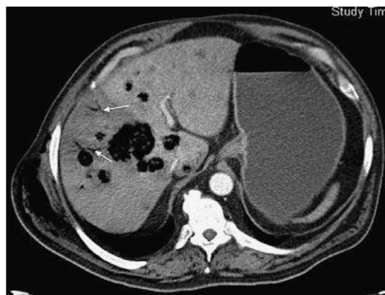
Figura 2 Tromboflebitis portal (flechas).

Varón de 54 años de edad, diabético, que presenta lesión indurada a la altura del glúteo derecho que el paciente relaciona con lipoma probablemente sobreinfectado. Destaca crepitación a nivel cutáneo que abarca desde tercio distal de ambas extremidades inferiores hasta el hombro y la zona interescapular derecha. Se realiza tomografía toracoabdominal en la que se observa enfisema subcutáneo desde ambos miembros inferiores, que se extiende por la pared abdominal derecha, afecta el miembro superior del mismo lado y alcanza la pared torácica posterior (fig. 1). Presenta el hígado aumentado de tamaño con hipodensidad bien delimitada a la altura del lóbulo hepático derecho (indicativo de trastorno vascular) y múltiples lesiones focales, la mayoría de densidad líquida; algunas de éstas tienen abundante aire en su interior. También se visualiza aire intravascular a la altura de las venas ilíacas, que se extiende hacia la vena cava inferior y el sistema portal, compatible con tromboflebitis (fig. 2). El paciente presenta muy mala evolución y fallece a las pocas horas en situación de shock séptico y fallo múltiple orgánico.