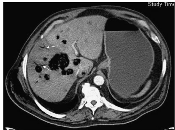
Figura 2 Tromboflebitis portal (flechas).

Varón de 54 años de edad, diabético, que presenta lesión indurada a la altura del glúteo derecho que el paciente relaciona con lipoma probablemente sobreinfectado. Destaca crepitación a nivel cutáneo que abarca desde tercio distal de ambas extremidades inferiores hasta el hombro y la zona interescapular derecha. Se realiza tomografía toracoabdominal en la que se observa enfisema subcutáneo desde ambos miembros inferiores, que se extiende por la pared abdominal derecha, afecta el miembro superior del mismo lado y alcanza la pared torácica posterior (fig. 1). Presenta el hígado aumentado de tamaño con hipodensidad bien delimitada a la altura del lóbulo hepático derecho (indicativo de trastorno vascular) y múltiples lesiones focales, la mayoría de densidad líquida; algunas de éstas tienen abundante aire en su interior. También se visualiza aire intravascular a la altura de las venas ilíacas, que se extiende hacia la vena cava inferior y el sistema portal, compatible con tromboflebitis (fig. 2). El paciente presenta muy mala evolución y fallece a las pocas horas en situación de shock séptico y fallo múltiple orgánico.