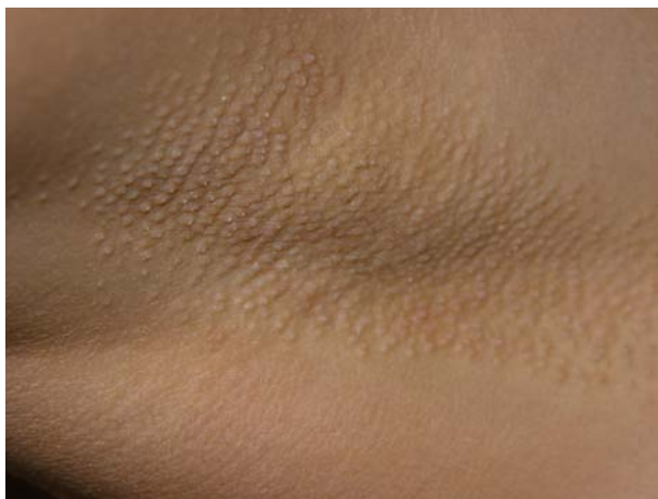
Fig. 1.—Pápulas de distribución folicular en la axila.

1-2 mm de diámetro, en axilas, formando placas de límites bien definidos, de forma bilateral y simétrica (fig. 1). Estas lesiones eran levemente pruriginosas. Se observaba una disminución del vello axilar. Existían también lesiones similares menos llamativas en areolas mamarias y región púbica. Se realizó biopsia cutánea de las lesiones axilares, que mostró espongiosis en el punto de entrada de la glándula apocrina en el epitelio infundibular, coincidiendo con un tapón córneo suprayacente, y un ligero infiltrado inflamatorio perifolicular (figs. 2 y 3). No presentaba ningún trastorno en las hormonas sexuales ni estaba tomando anticonceptivos orales. Dada la escasa sintomatología, se mantuvo una actitud conservadora y se pautó corticoterapia tópica en caso de cursar con prurito.