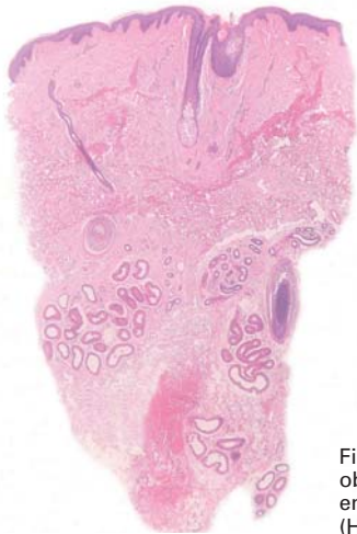
Fig. 2.—Piel axilar en la que se observa un foco de espongiosis en el epitelio indundibular. (Hematoxilina-eosina x20.)