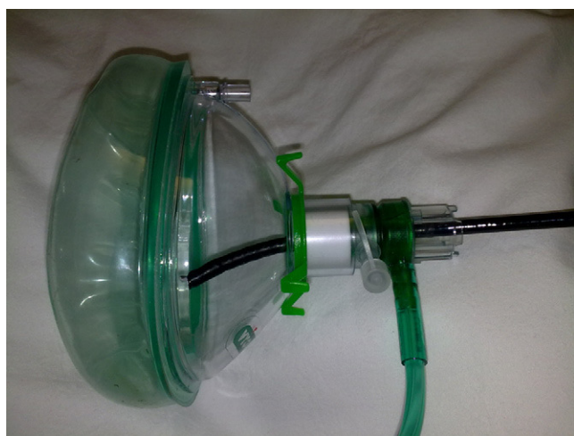
Figura 2 Válvula de Boussignac conectada a una mascarilla. Fibrobronscopia a través de la válvula.

Presentamos 3 casos en los que la realización del procedimiento endoscópico en situación límite (pO 2 /FiO 2 < 150)